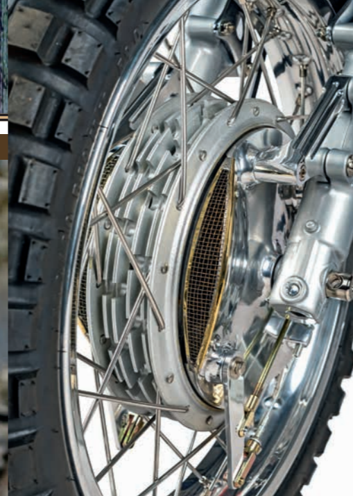
Le tambour quatre cames avant est une pure merveille. Il a pour origine une Honda 250 Four de course de 1964. Remarquez la ventilation. Pour y venir ancrer la fourche d'origine Harley, il a fallu quelques adaptations.