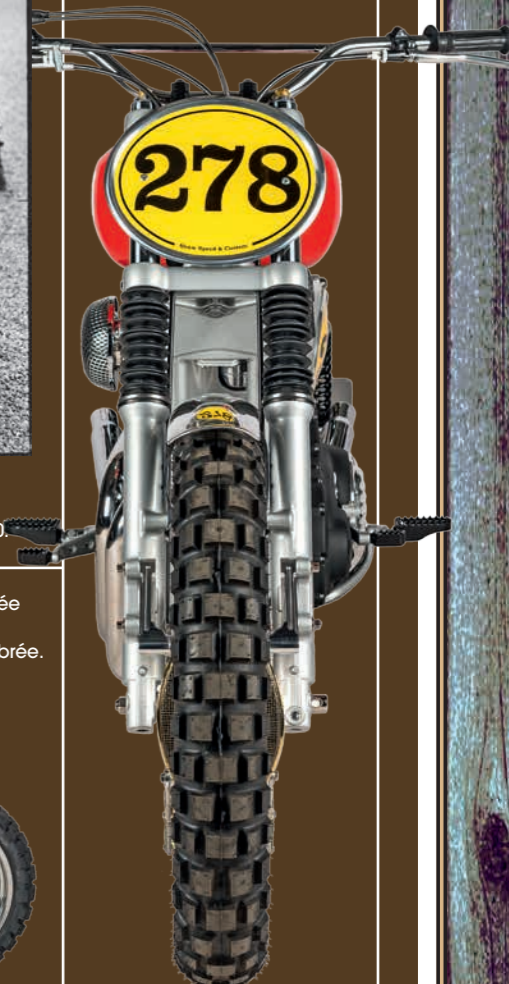
Superbe avant avec ses pneus à crampon, ses soufflets de fourche et son guidon Magura. Qui peut soupçonner que derrière cet accastillage se cache un bon gros twin de Milwaukee ?