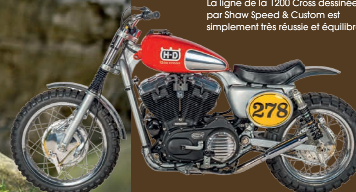
La ligne de la 1200 Cross dessinée par Shaw Speed & Custom est simplement très réussie et équilibrée.