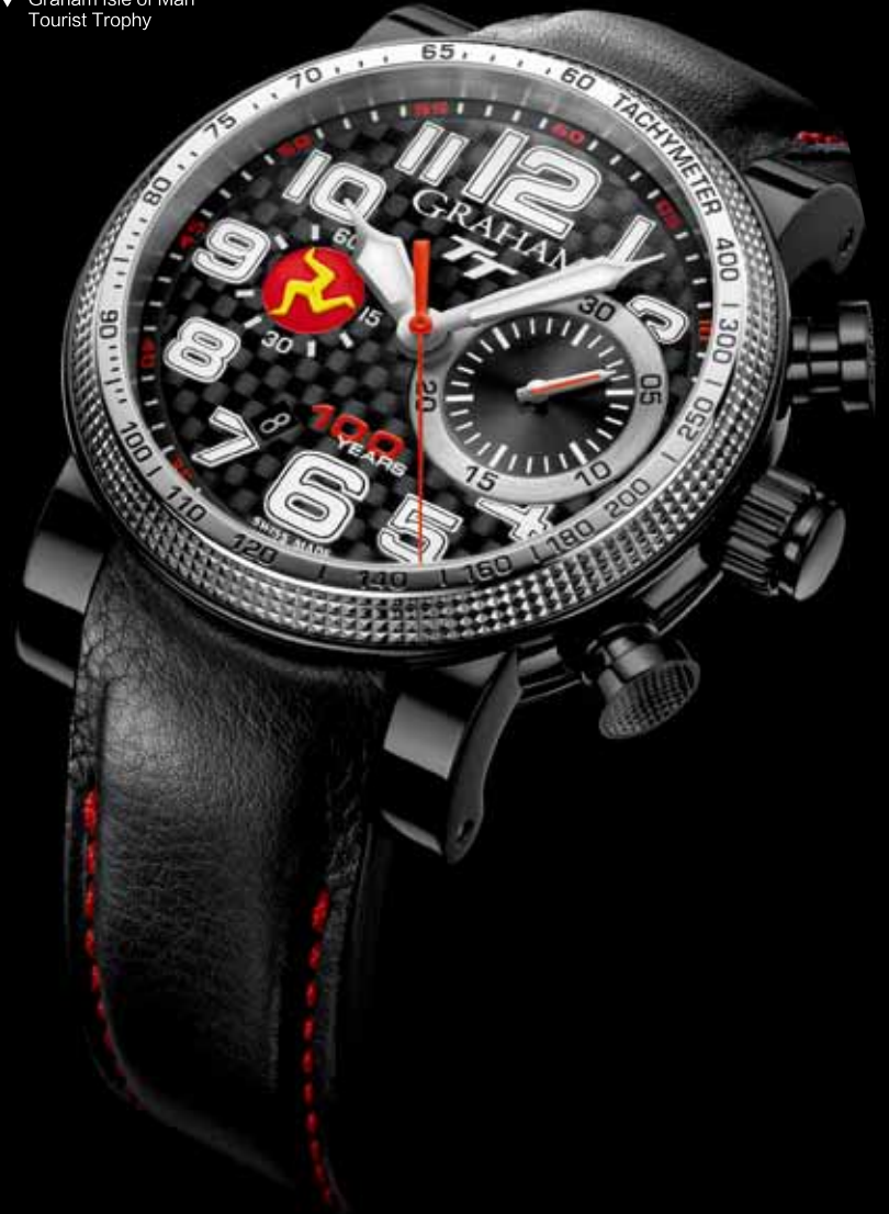
▼ Graham Isle of Man Tourist Trophy

想随时点燃炫酷？你不用成为专业车手。那些与顶级车商合作的时计就能让你瞬间拥有手腕上的魔力。近几年帝舵表就与杜卡迪玩得热火，广受追捧的FASTRIDER（快骑手）腕表系列便是这家意大利摩托厂商最成功的诠释者。而像百年灵与宾利、积家与阿斯顿马丁这类合作关系，一直都被市场推崇。积家的腕表甚至能够直接用来开启阿斯顿马丁跑车车门。无论是飞驰在林荫大道上，还是在弯曲盘旋的小路间酷玩甩尾，你手上的精密时计就是激情燃烧的“刻度表”——它的性能越显锐利，你的“酷”指数就越加疯狂。