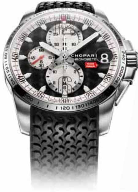
▼ Chopard Mille Miglia GT XL Chrono