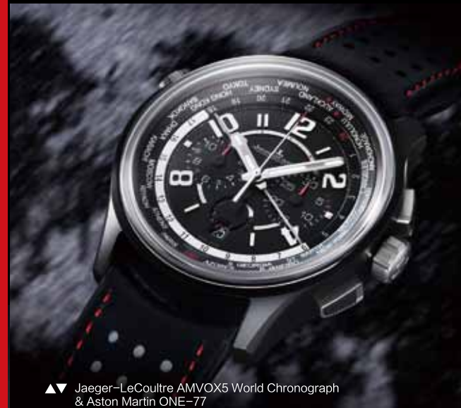
▲▼ Jaeger-LeCoultre AMVOX5 World Chronograph & Aston Martin ONE-77