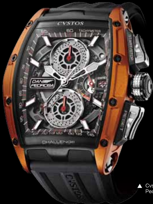
▲ Cvstos Challenge Dani Pedrosa