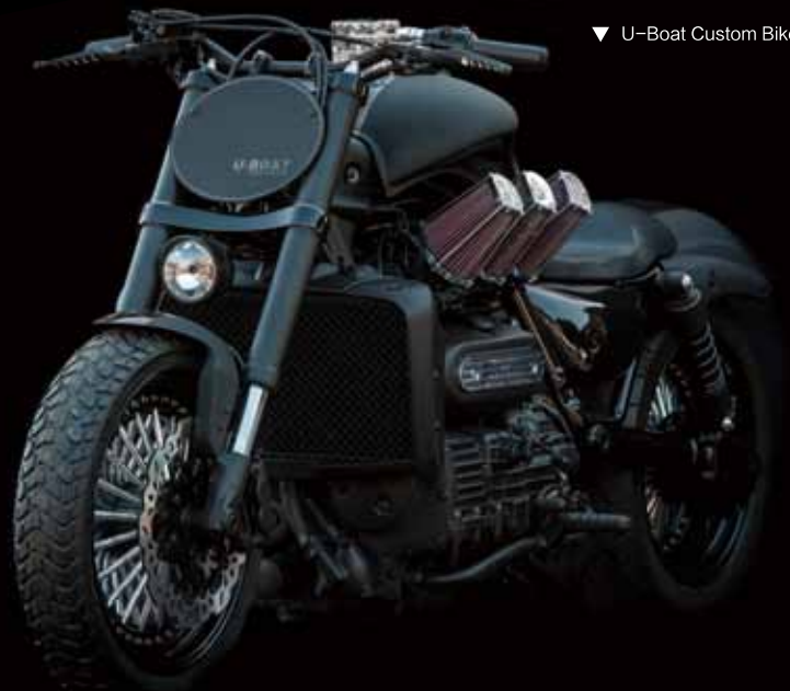
▼ U-Boat Custom Bike