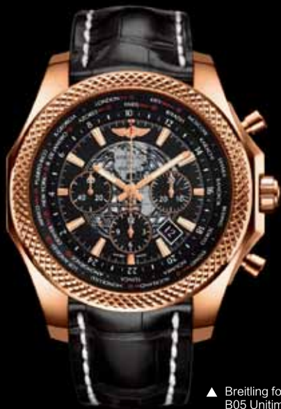
▲ Breitling for Bentley B05 Unifime