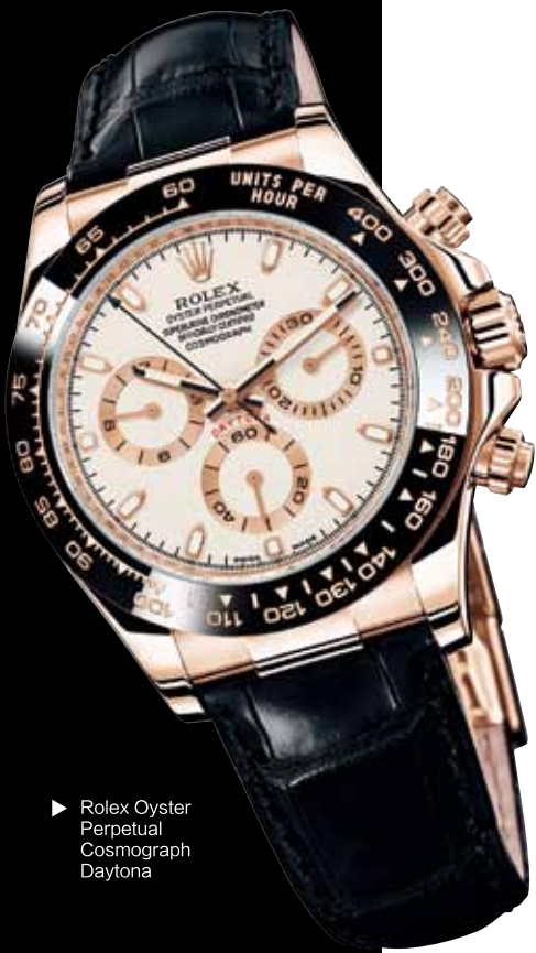
► Rolex Oyster Perpetual Cosmograph Daytona