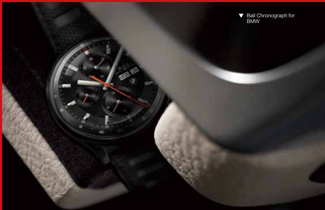
▼ Ball Chronograph for BMW