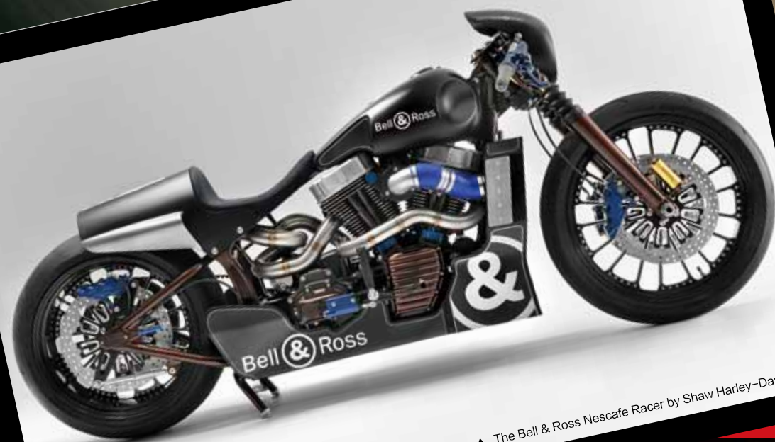
▲ The Bell & Ross Nescafe Racer by Shaw Harley-Davidson

现下，摩托虽然还是不少人的耍酷首选，但全球财富的剧烈膨胀早已将顶级跑车推入常人眼帘，那股在昔日街头似乎只属于摩托的热烈噪声，如今已被跑车更为夸张的轰鸣抢走不少风头。摩托，渐渐长出了复古的格调，温馨而且神秘。