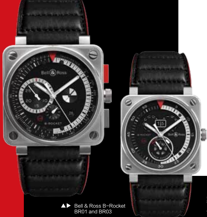
▲▲ Bell & Ross B-Rocket BR01 and BR03