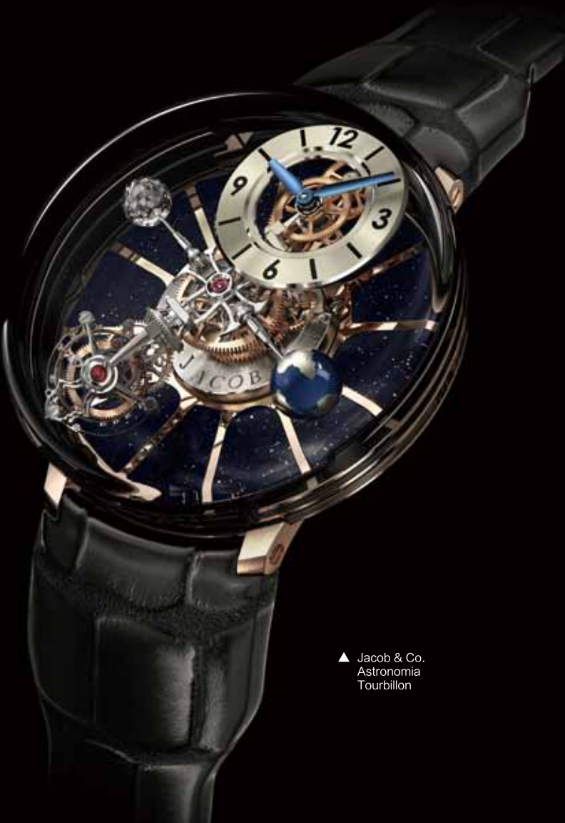
▲ Jacob & Co. Astronomia Tourbillon