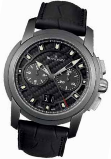
▲ Blancpain L-Evolution

想随时点燃炫酷？你不用成为专业车手。那些与顶级车商合作的时计就能让你瞬间拥有手腕上的魔力。近几年帝舵表就与杜卡迪玩得热火，广受追捧的FASTRIDER（快骑手）腕表系列便是这家意大利摩托厂商最成功的诠释者。而像百年灵与宾利、积家与阿斯顿马丁这类合作关系，一直都被市场推崇。积家的腕表甚至能够直接用来开启阿斯顿马丁跑车车门。无论是飞驰在林荫大道上，还是在弯曲盘旋的小路间酷玩甩尾，你手上的精密时计就是激情燃烧的“刻度表”——它的性能越显锐利，你的“酷”指数就越加疯狂。