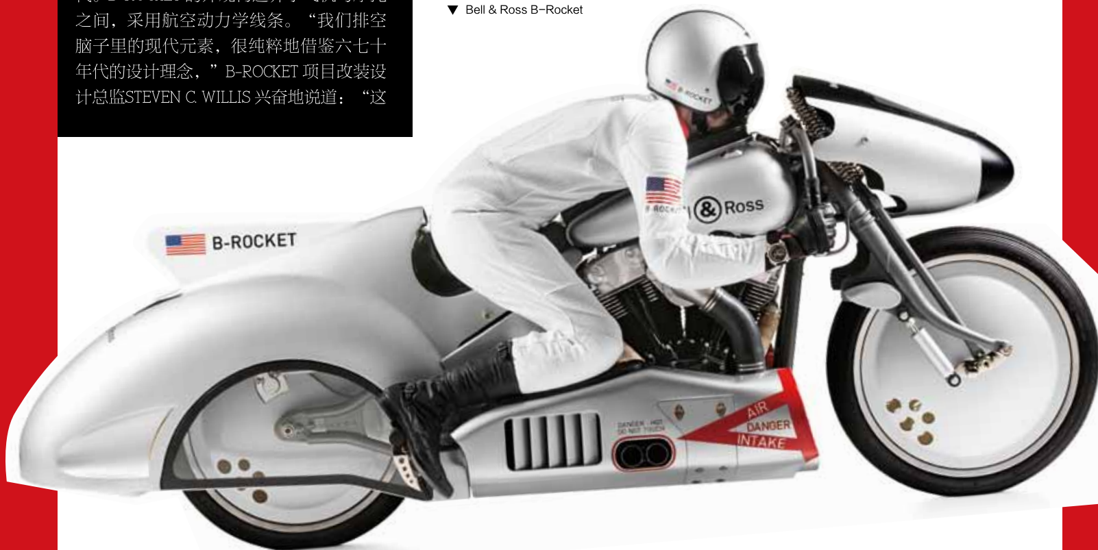
▼ Bell & Ross B-Rocket

采用尖端技术结合怀旧美感是复古的一个趋势。当职业明星驾驭这类坐骑环游各地，改装文化与腕表主题的巧妙嫁接给铁粉们带来新的玩法，速度与時計的搭配法则将会再度进化。