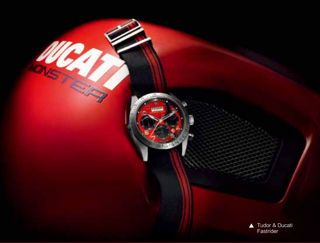
▲ Tudor & Ducati Fastrider