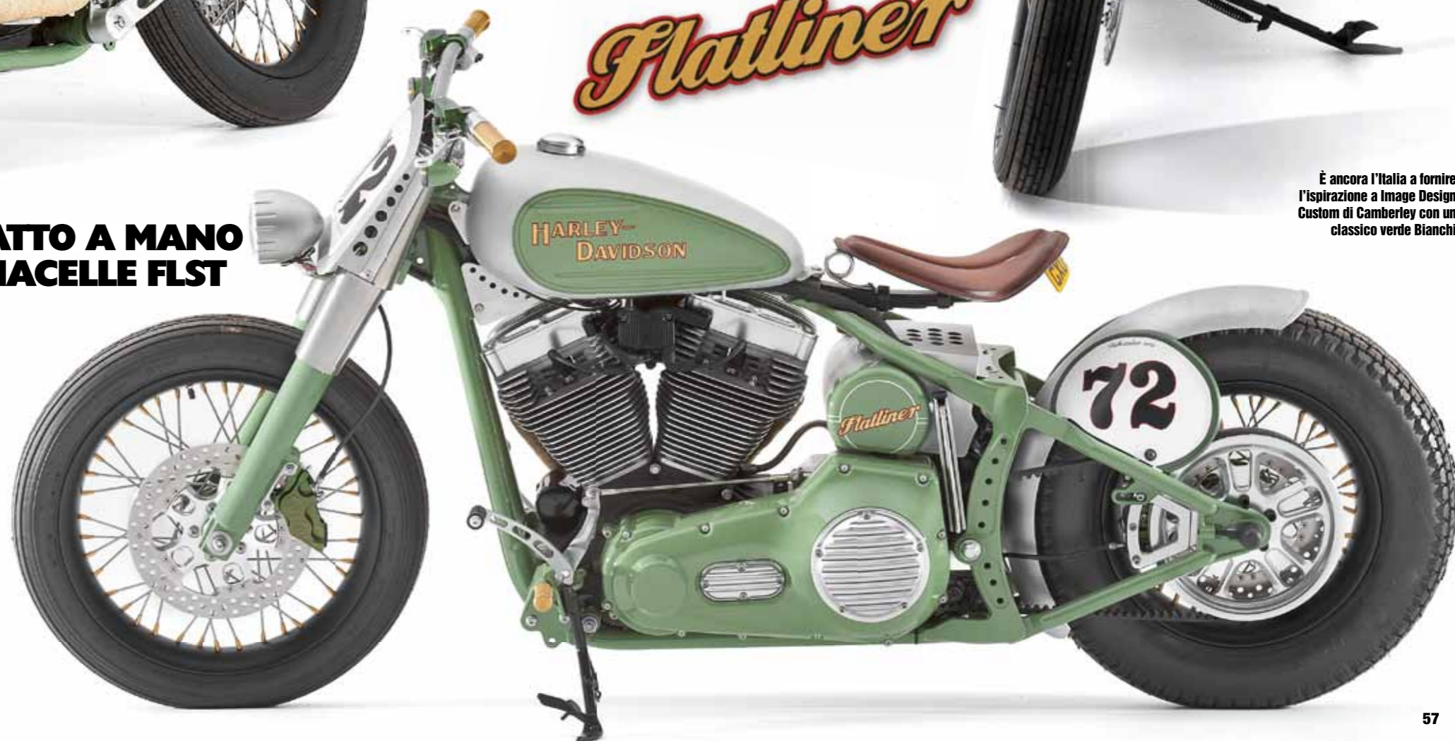
È ancora l'Italia a fornire l'ispirazione a Image Design Custom di Camberley con un classico verde Bianchi

illuminate e posizionate dietro al barilotto dell'olio realizzato in casa come il parafrangente posteriore. Profondamente modificato il serbatoio Sportster Custom post-2004 a cui vengono applicate due pance piatte con evidenti scanalature e decal classiche: effetto vintage immediato! Minimalismo e particolare attenzione al dettaglio killer sono tratti somatici comuni a tutte le preparazioni curate dal team SS&C; ciò che colpisce anche l'occhio più critico è la capacità di escogitare sempre nuove soluzioni. Il filtro aria in ottone, ricavato da un particolare di una pompa di sentina, è già apparso davanti al modulo dell'iniezione di Salt Flat Special; su Flatliner presenta un'alettatura differente per mantenere una certa unicità e si abbina idealmente con le manopole con gas interno e le pedane "brass billet" fornite dai