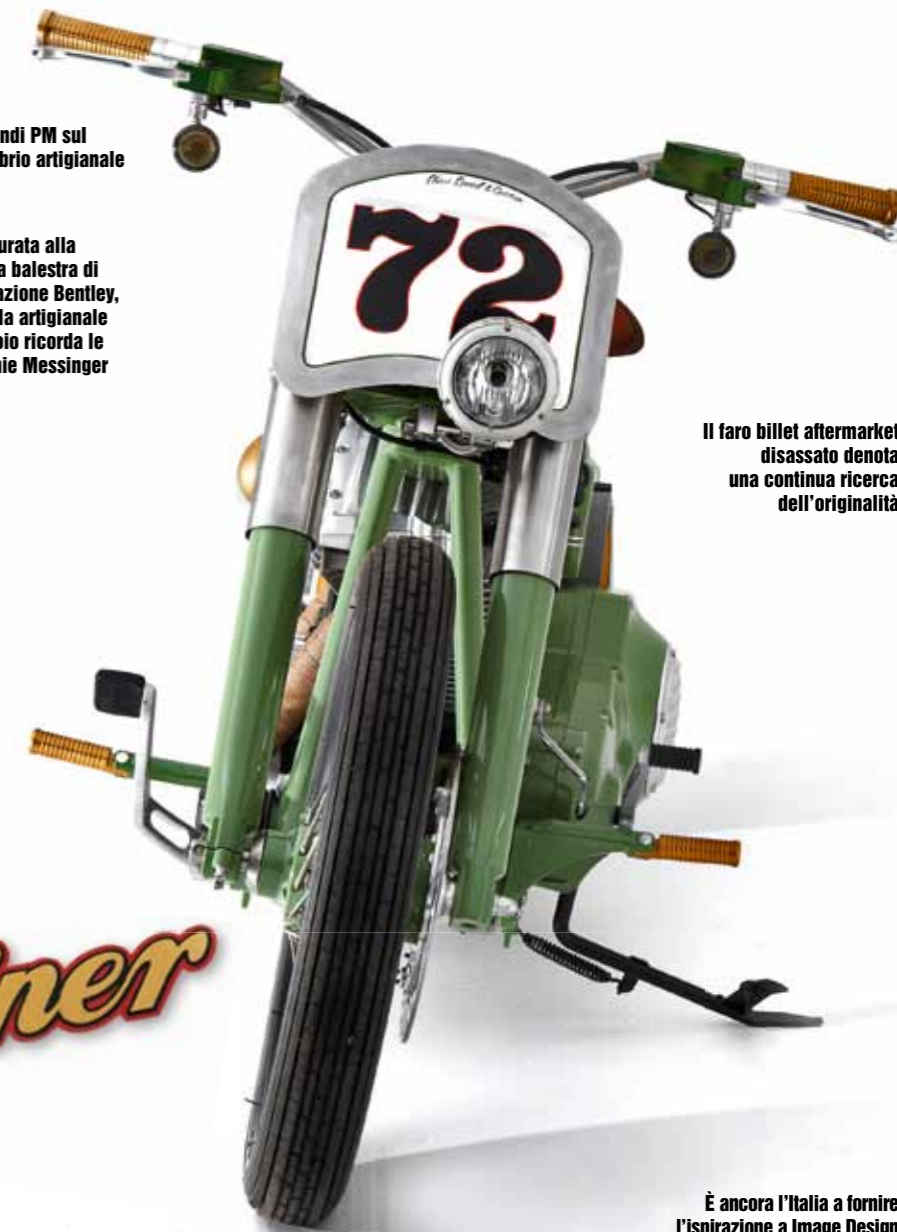
Il faro billet aftermarket disassato denota una continua ricerca dell'originalità

romagnoli di Chop's 76. Anche elementi prelevati dal catalogo Roland Sands Design, presenza pressoché fissa sulle special SS&C, non sfuggono a un trattamento ad hoc. Tutte le cover RSD della serie Nostalgia che guarniscono il Twin Cam B portato a 1.550 cc sono rese più brillanti grazie a un'anodizzazione argentea. Perfino la collaudata ciclistica che equipaggia Heritage Softail in origine viene rivista all'insegna della snellezza. I cerchi a raggi da 19" e 16", con canale Profile nero opaco, sono un puzzle di componenti H-D. Vengono rivestiti da pneumatici Avon old style, una scelta quasi obbligatoria, ma il tocco magico non manca... Sul mozzo è impresso l'iride Campagnolo, simbolo di eccellenza ciclistica italiana, preso a prestito per coronare un esempio di classe britannica!