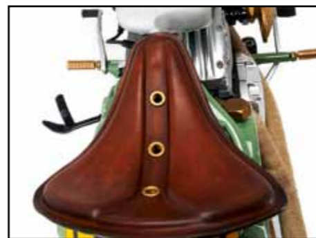
Comandi PM sul manubrio artigianale