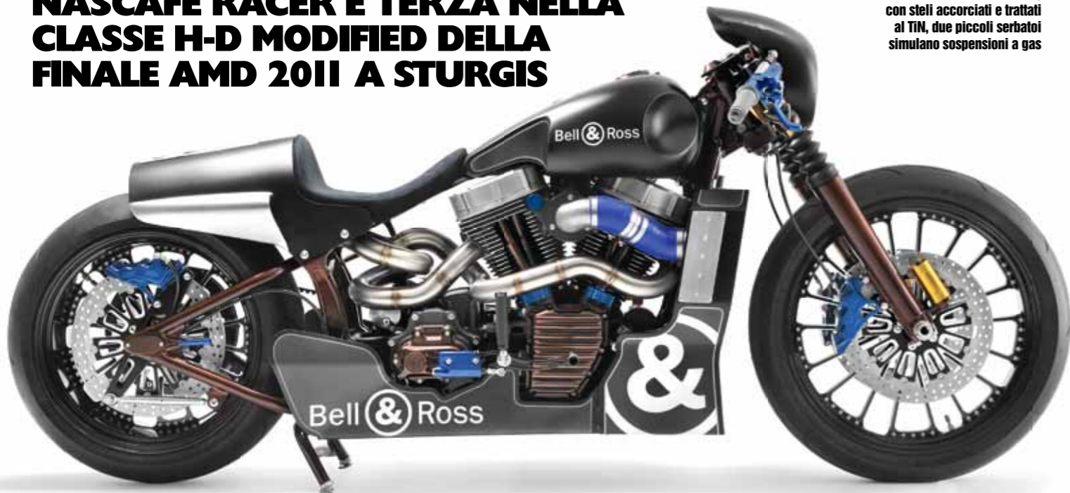
Sui foderi della forcella FXST, con steli accorciati e trattati al TiN, due piccoli serbatoi simulano sospensioni a gas