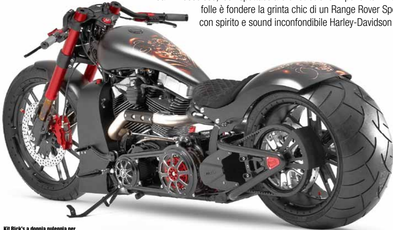
Kit Rick's a doppia puleggia per montare un Metzeler 300/35 VR 18" al posto del 240/40 stock