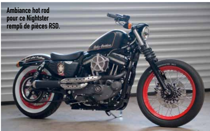
Ambiance hot rod pour ce Nightster rempli de pièces RSD.

Q uel est donc le secret de l'équipe de Shaw, dont la concession existe depuis 11 ans mais dont le département customisation n'est en place que depuis trois années? Comment font-ils pour sortir presque à la chaîne autant de bécans customisées, de l'accessoirisation légère au full custom le plus radical? Il n'y a pas de recette magique, tout réside dans le fait que l'équipe est surmotivée et suffisamment nombreuse pour offrir un service cinq étoiles au client. Celui qui vient passer commande d'une moto sur mesure est ici accueilli dans un salon VIP et a à faire à son "project manager" personnel, qui supervise la construction de A à Z en faisant le lien entre le client et l'atelier. C'est ce qui permet aux Shaw boys d'avoir un carnet d'adresses qui compte tout le gratin du show-biz londonien, mais aussi une belle clientèle internationale. Autre constante chez ce préparateur anglais: ses liens étroits avec des leaders du marché de