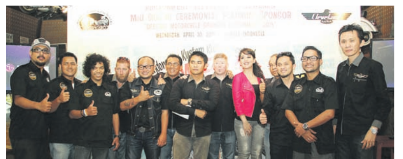
Kru Kustomfest & CCW berfoto bersama

Untuk pasar Indonesia, CCW akan menghadirkan variannya, Ace Deluxe (bergaya retro 250cc), Heist (bertampang traditional chopper 250cc), dan Misfit (desain café racer 250cc). Soal harga motor Cleveland yang dijual di Indonesia berkisar di bawah Rp 75 juta. Menariknya, CCW juga telah menyiapkan spare parts dan custom kit untuk tiap tipe motor.