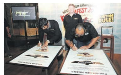
Penandatanganan kerjasama CCW - Kustomfest

"Kami akan berikan 10 motor Cleveland kepada 10 builder terpilih untuk kemudian mereka kustom dengan material yang sama dan telah kami sediakan," papar Lulut. Pemenang program Bike Build-Off ini akan diumumkan di Kustomfest 2014 dengan juri seorang master builder dunia. Siapa dia? Tunggu kejutannya.