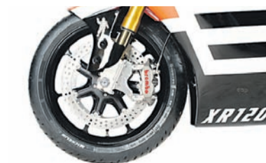
Cakram RSD Morris terpasang pada pelek Dymag yang dibalut ban Michelin Power Sport.