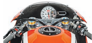
Spidometer dan rpm yang sangat besar memenuhi area cockpit.