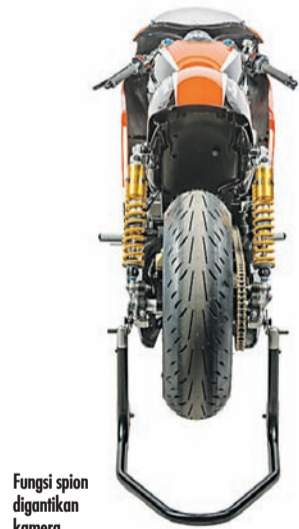
Fungsi spion digantikan kamera