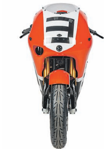
Lampu depan tersamar