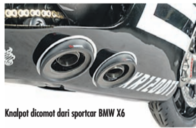
Knalpot dicomot dari sportcar BMW X6